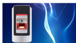
Wiegand 26 bit