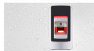
Waterproof degree: IP68